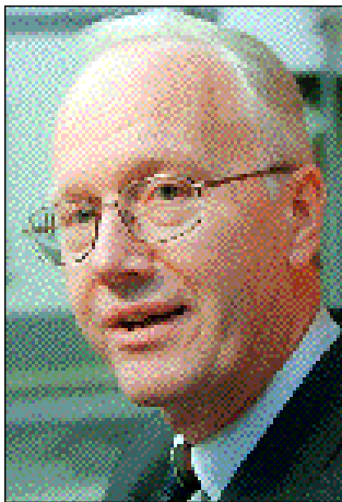
Nr. 1 - 40,6 point

susanne.tholstrup@borsen.dk kasper.jacobsen@borsen.dk