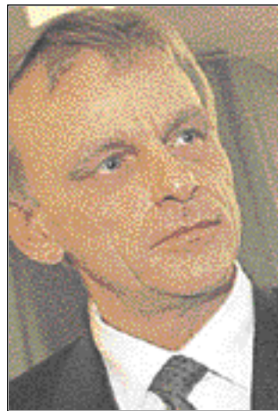
Nr. 3 - 24,0 point