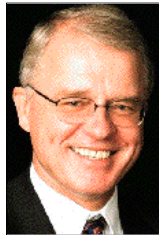
Nr. 4 - 22,0 point