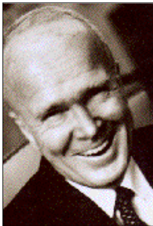
Nr. 2 - 28,6 point